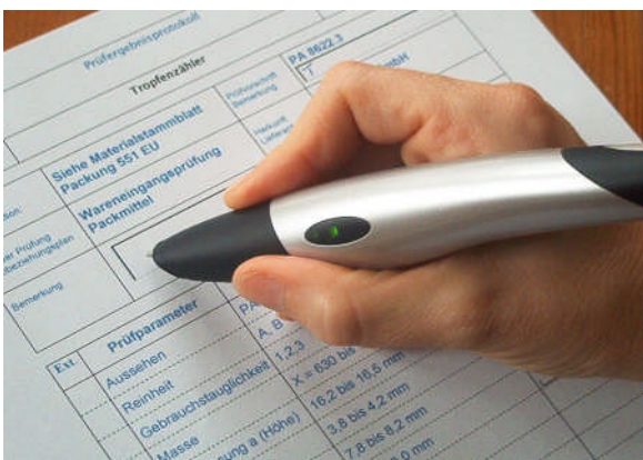
Abbildung 2: Formular

Jedes Formular ist mit einer Papierdefinition verknüpft. Diese Definition enthält wichtige Informationen zu dem Digitalpapier im verwendeten Formular. Diese Information nennt man Patterncode.